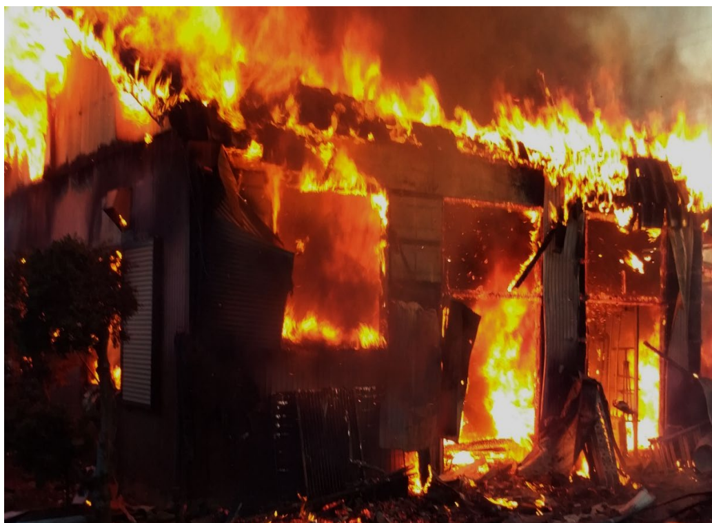
作業場で発生した建物火災