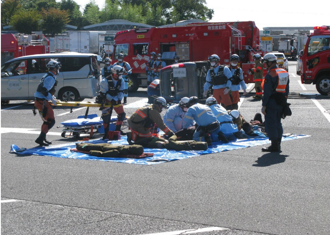
関越自動車道埼玉県消防連絡協議会合同訓練