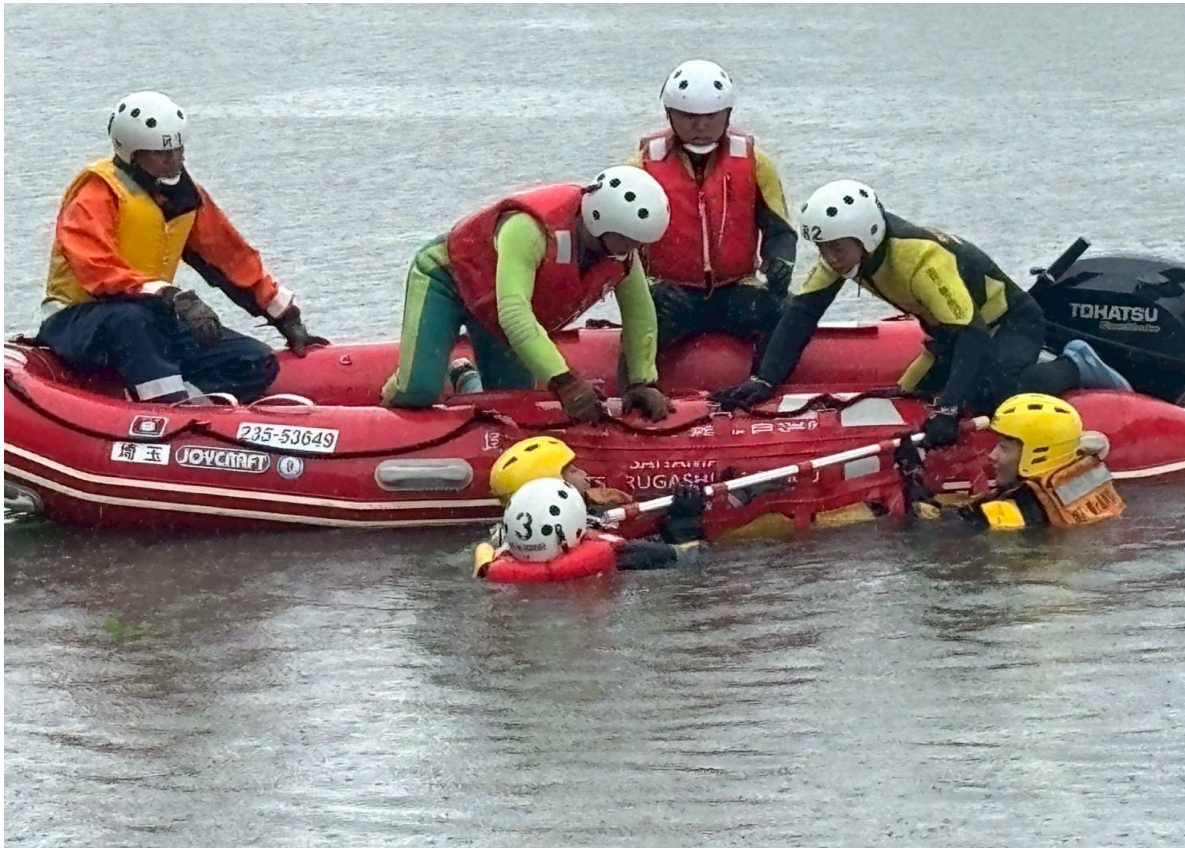
令和7年度河川想定訓練