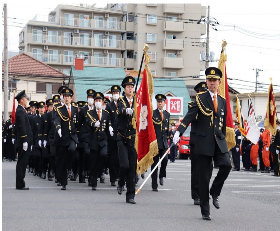
令和7年1月12日 消防出初め式 分列行進