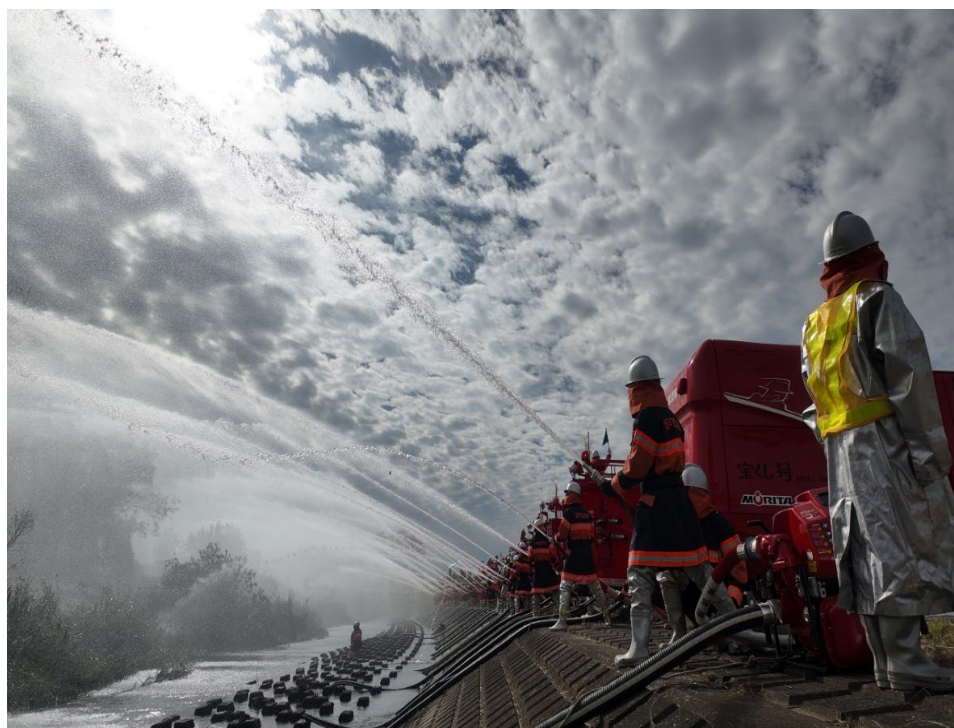
令和7年11月2日 特別点検 放水試験