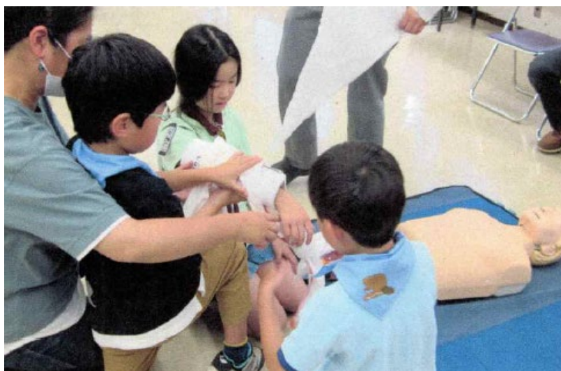
令和7年度消防署体験入署 坂戸地区少年消防クラブ