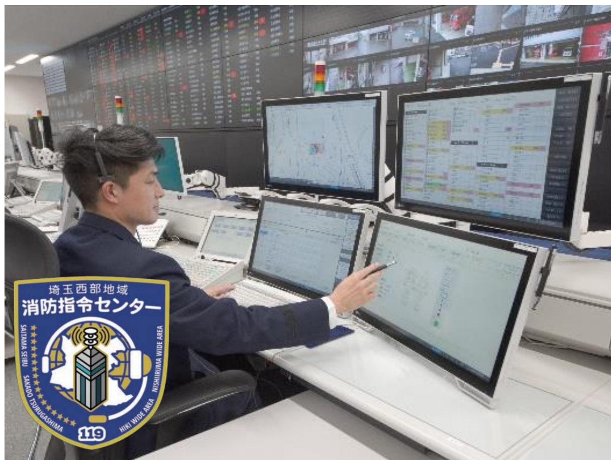
埼玉西部地域消防指令センター(令和6年4月1日運用開始)